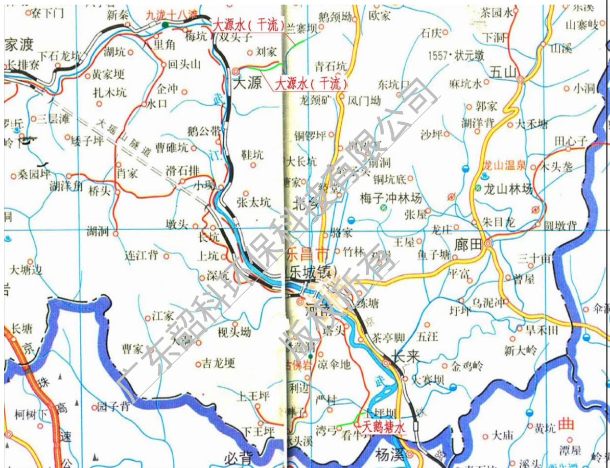
图 1 项目地理位置图

本治理工程分别为：大源水（干流）治理长度为 3.55km，大源水（支流）治理长度为 1.08km，天鹅塘水治理长度为 2.94km。